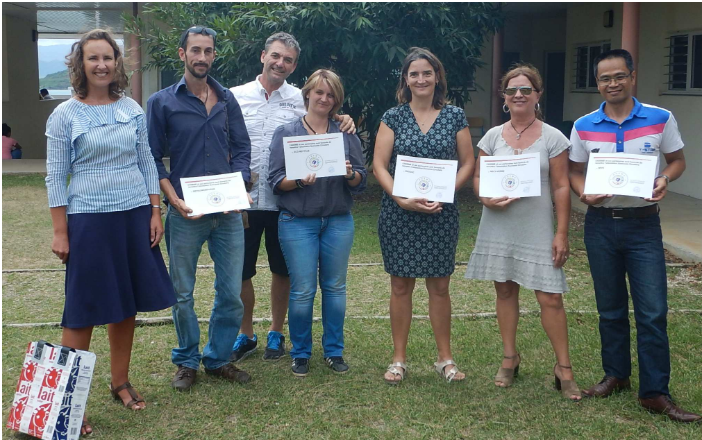
Figure 2 : Remise des labels Economie Circulaire 2016.

La remise des labels aura lieu lors du lancement de la Semaine Européenne de Réduction des Déchets, le 16 novembre 2018.